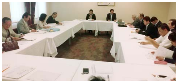
例会後 クラブ協議会 2014～2015年度 船橋市東 RC 活動方針と活動計画 今年度クラブテーマ「気品と風格」